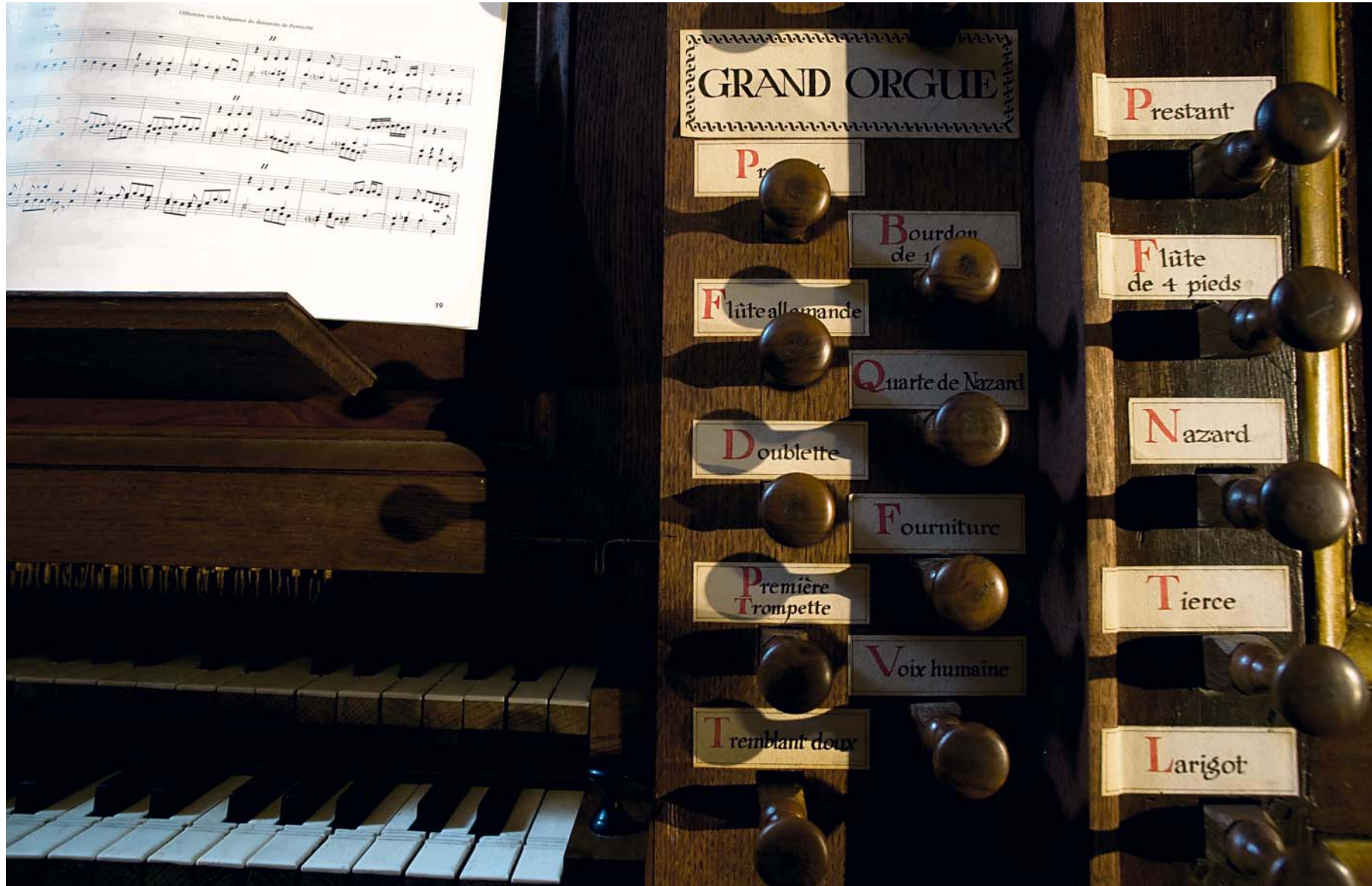
Vue du grand orgue installé dans l'église Sainte-Marie.

Feller propose d'organiser une « académie d'orgue internationa-